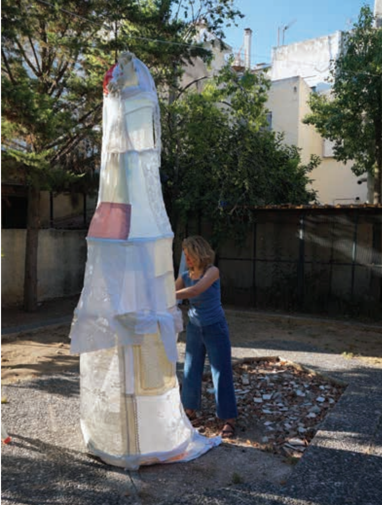
Μυρτώ Χμιελέφσκι, Πρώτη ύλη , εγκατάσταση