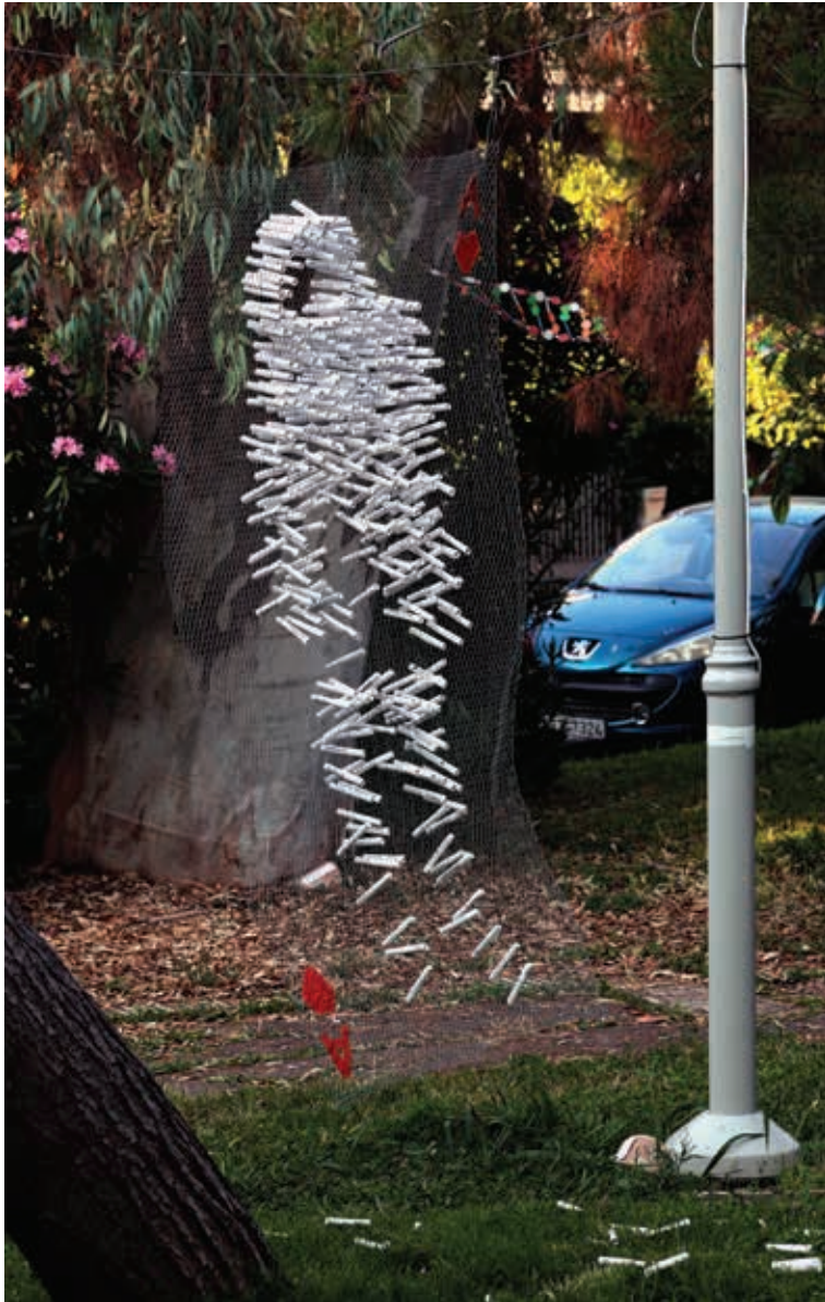
Γιώργος Θεοδώρου, Άσσος, εγκατάσταση