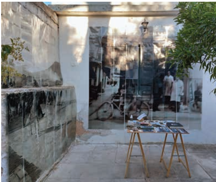
Νίκος Παπαδημητρίου – Κώστας Τσώλης, Σμυρνέικο μινόρε , ηχητική εγκατάσταση