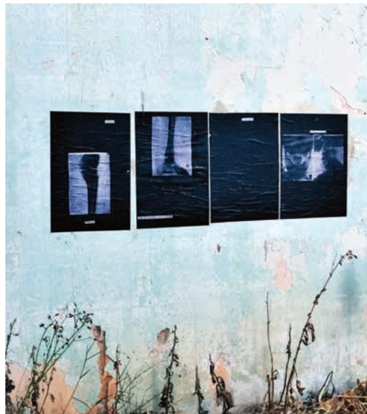
Έλενα Ακύλα, Επί δύο περιπτώσεων , in-situ παρέμβαση