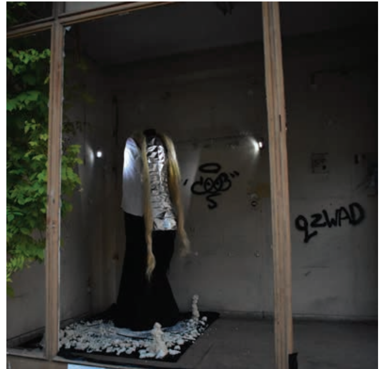
Τσουλούφη Άννα, Η Φύλακας, η Φωνή και η Σκιά, ηχητική εγκατάσταση