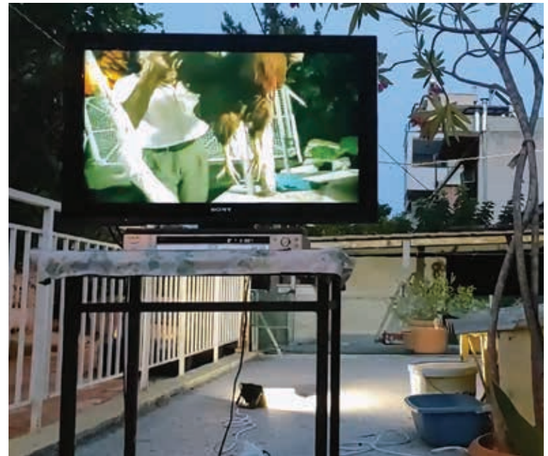
Εύα Στεφανή – Νίκος Ζωιόπουλος, Συγκάτοικοι , βίντεο