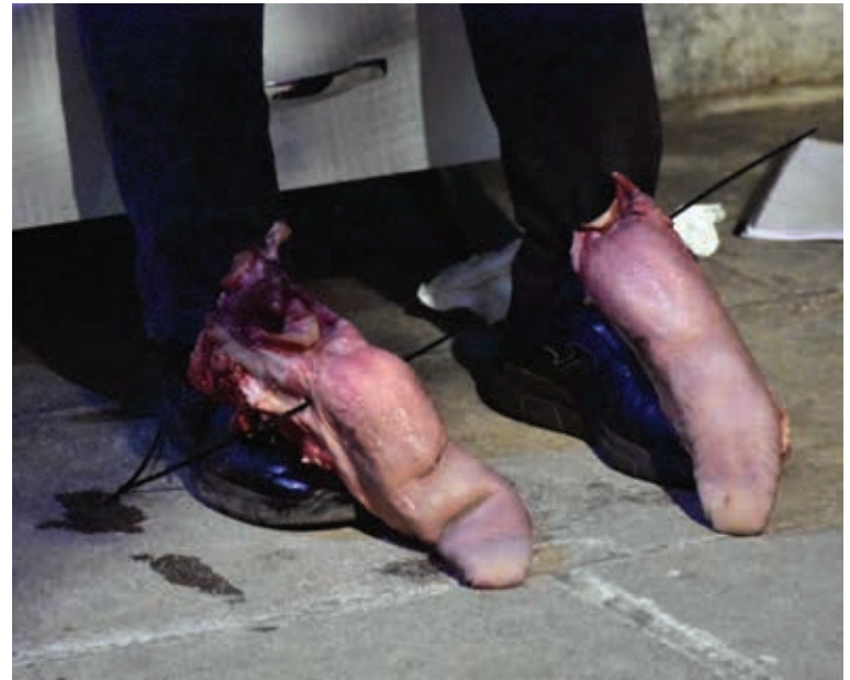
Δημήτρης Χαλάτσας, Άρθρον 59 , performance