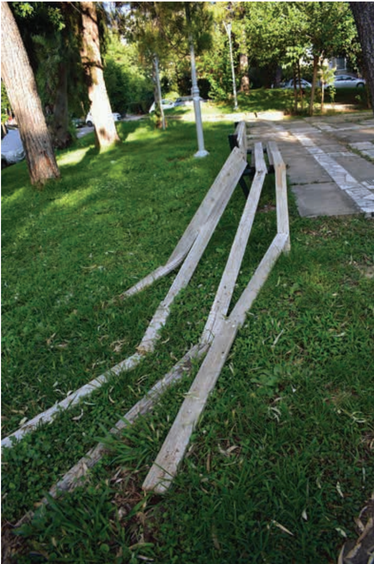
Δημήτρης Γεωργακόπουλος, Structural unit A , παρέμβαση-εγκατάσταση