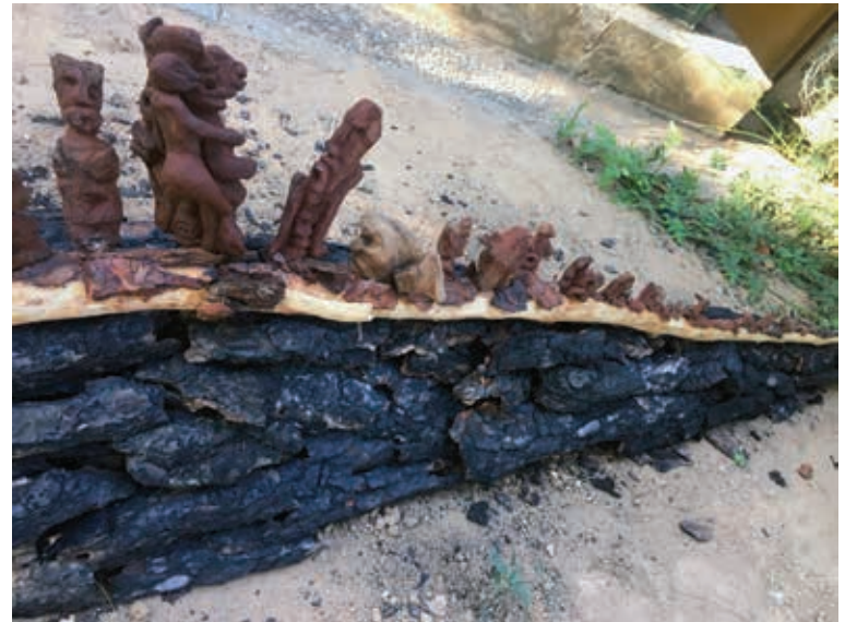
Διονύσης Ματαράγκας, Η φωτιά , εγκατάσταση